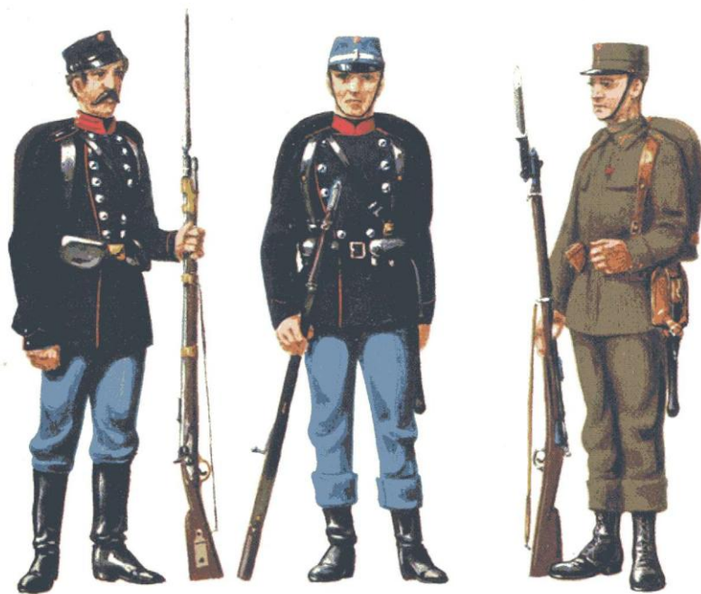
Fig. 4, 1855