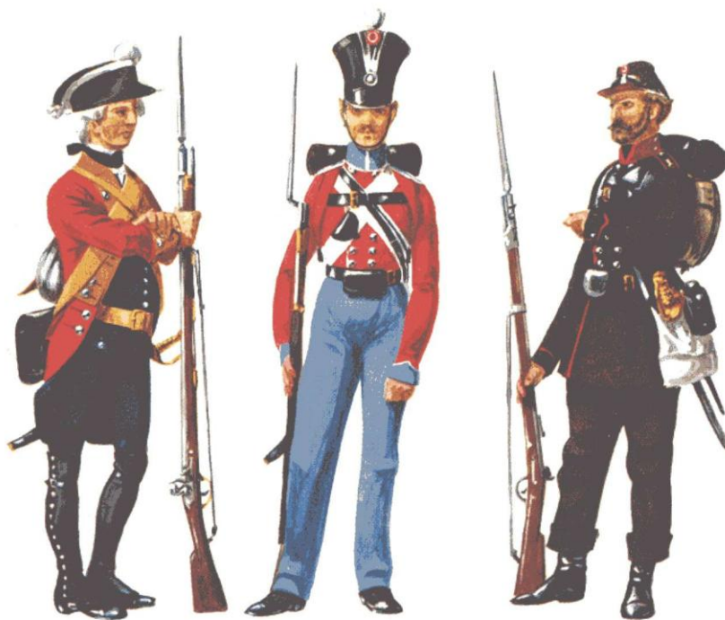
Fig. 1, 1763